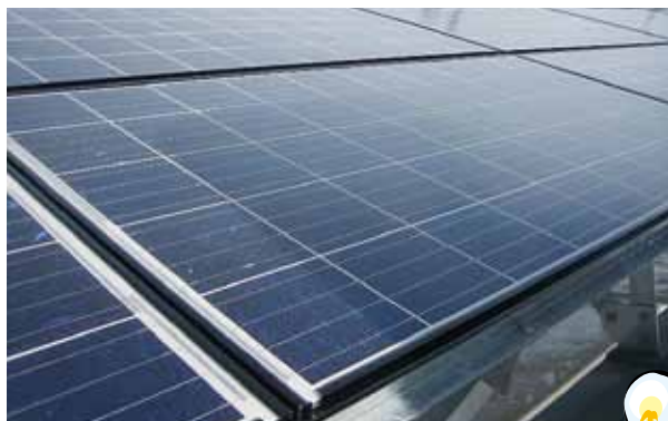
青海生涯学習センター 出力：10kW

平成22年11月完成の青海地域生涯学習センターに続き、平成23年3月完成の能生生涯学習センターにも太陽光発電システムが設置されました。