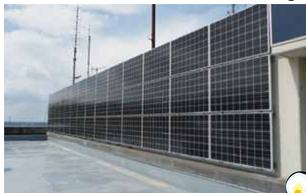
能生地域生涯学習センター 出力：10kW

10kWの太陽光発電システムは年間で約10,000kWh発電するとされています。